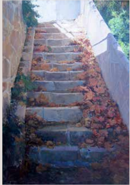
TARDORENC (Oli sobre llenç, 162 x 114 cm)