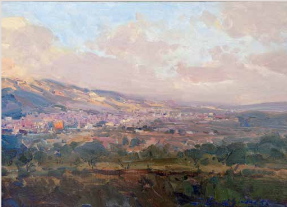
ALCOI (Oli sobre llenç, 33 x 46 cm)