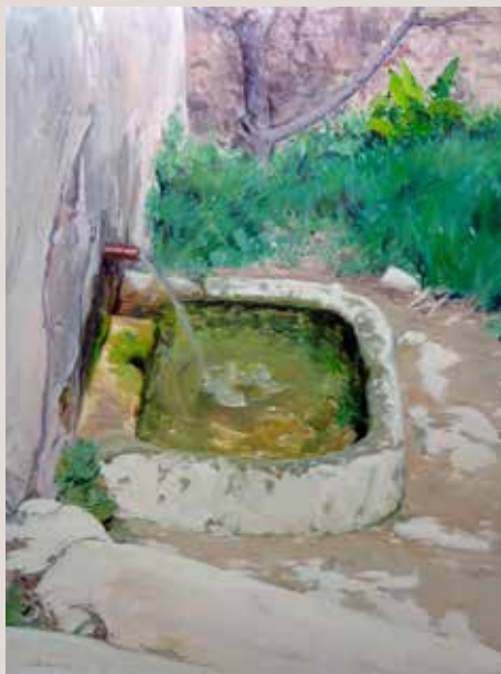
LA VELLA FONT (Oli sobre llenç, 92 x 73 cm)