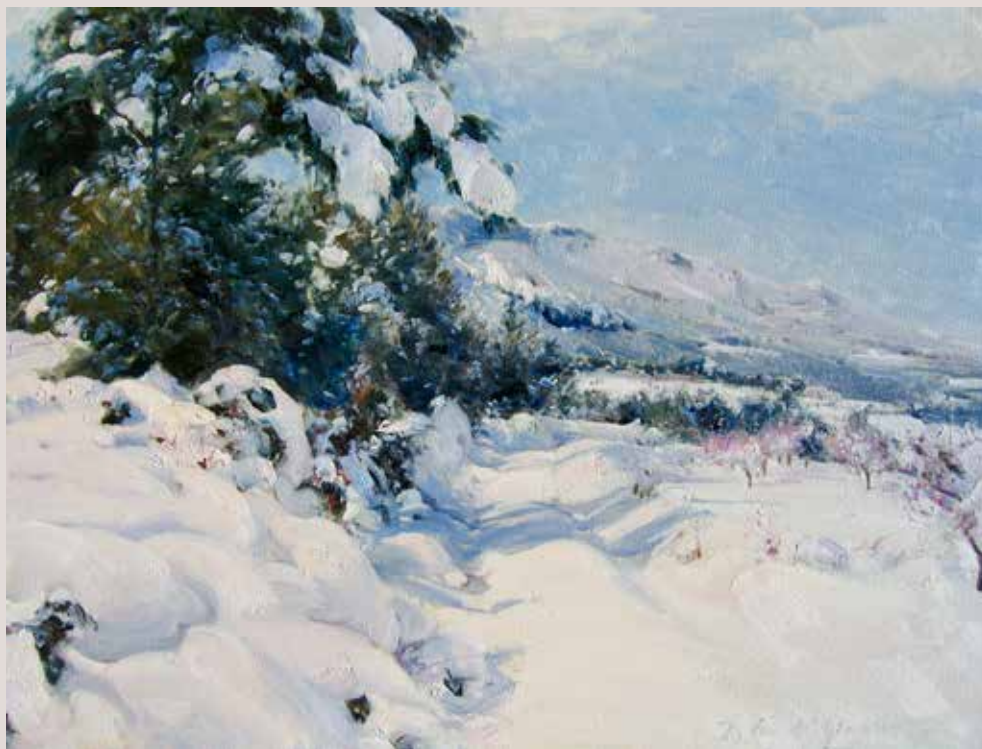
EL CARRASCAL NEVAT (Oli sobre llenç, 46 x 61 cm)