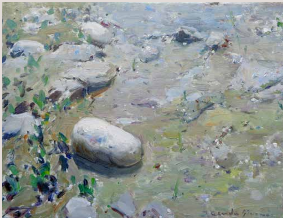
APUNT SERPIS 2 (Oli sobre llenç, 27 x 35 cm)