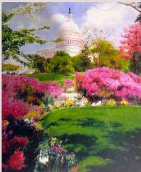
EL CAPITOLI (Oli sobre llenç, 195 x 162 cm)