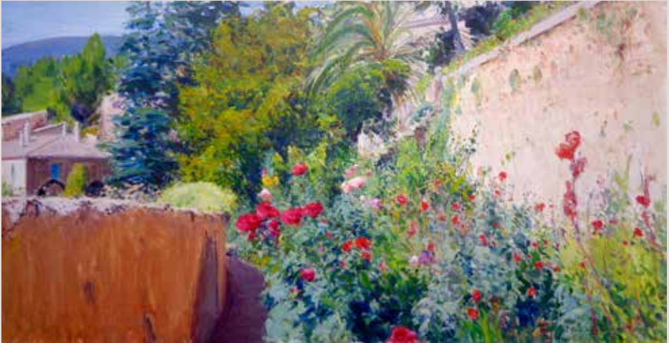
JARDINS BRUTINEL (Oli sobre llenç, 60 x 116 cm)