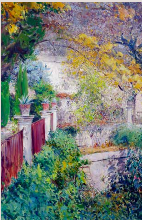
RACÓ JARDÍ DE BRUTINEL (Oli sobre llenç, 92 x 60 cm)