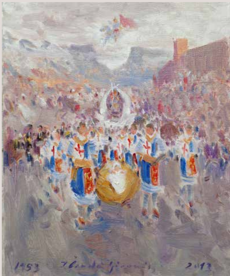
BATEIG DEL PINTOR (Oli sobre llenç, 22 x 27 cm)