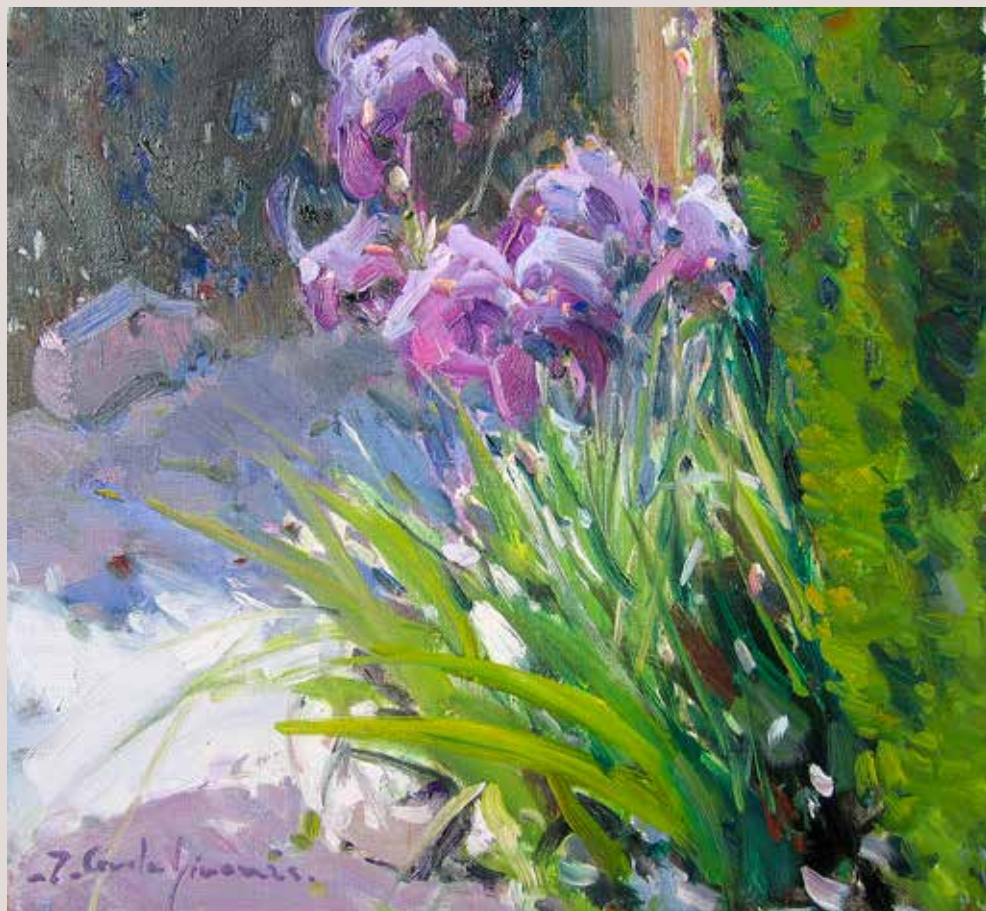
IRIS (Oli sobre llenç, 30 x 30 cm)