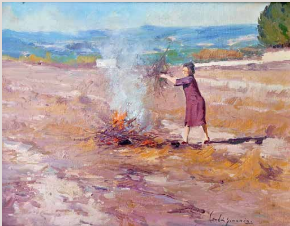
CREMANT RESTOLLS (Oli sobre llenç, 27 x 35 cm)