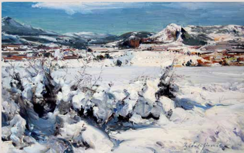
EL CASTELLAR AMB NEU (Oli sobre llenç, 38 x 61 cm)