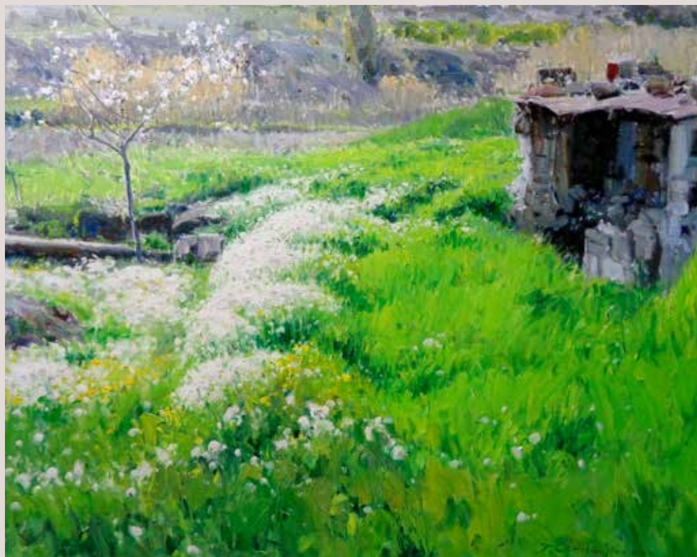
HERBA VERDA (Oli sobre llenç, 73 x 92 cm)