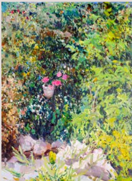
JARDÍ DE CASA AMB TEST (Oli sobre llenç, 61 x 46 cm)