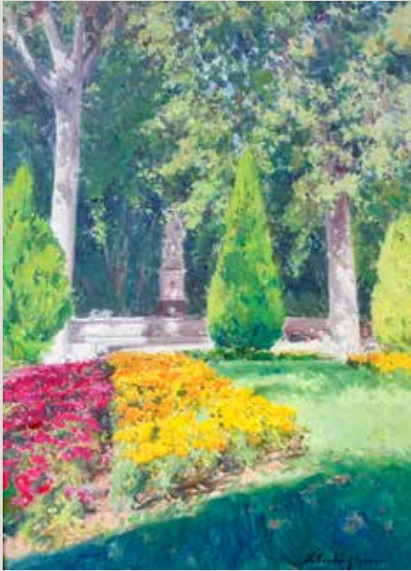
JARDÍ VALENCIÀ (Oli sobre llenç, 61 x 38 cm)