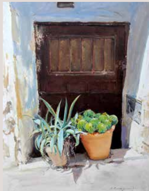
BOCAIRENT (Oli sobre llenç, 92 x 73 cm)