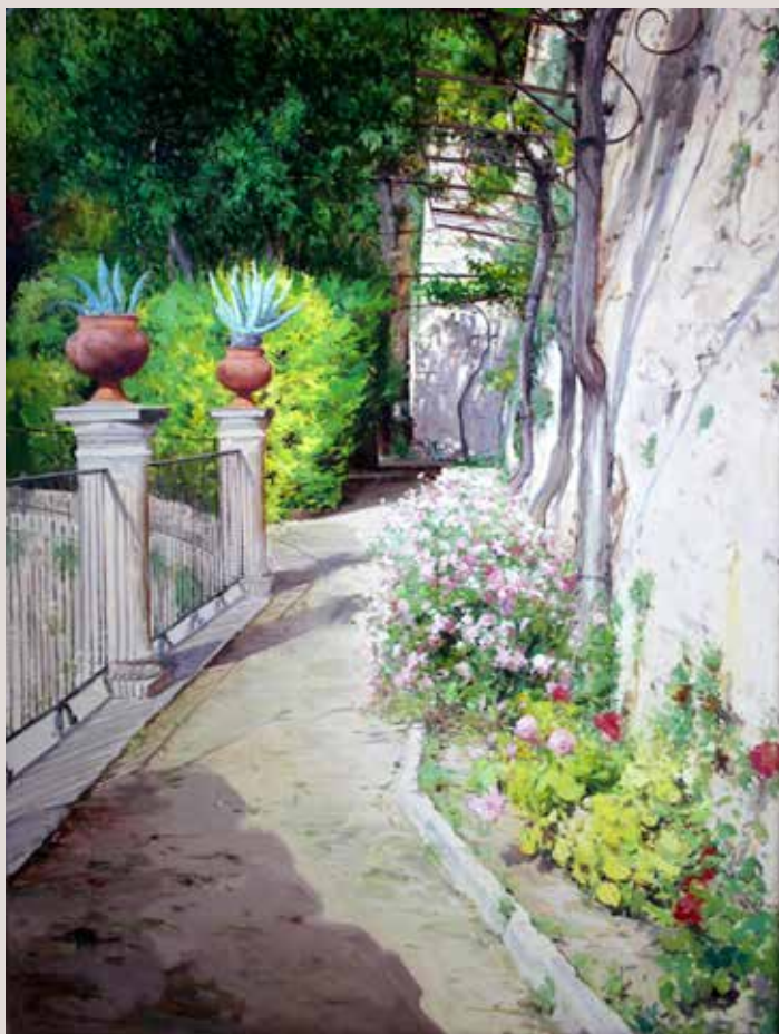
JARDINS DEL SALT (Oli sobre llenç, 116 x 89 cm)