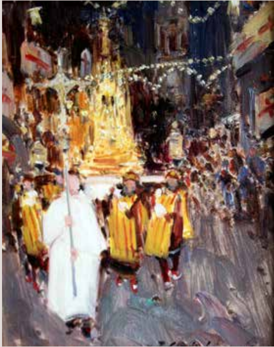
RELÍQUIA DE SANT JORDI (Oli sobre llenç, 27 x 22 cm)