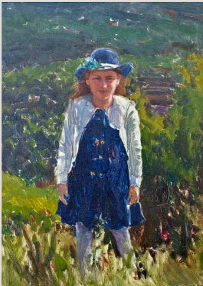
LUCÍA AMB BARRET (Oli sobre llenç, 46 x 33 cm)