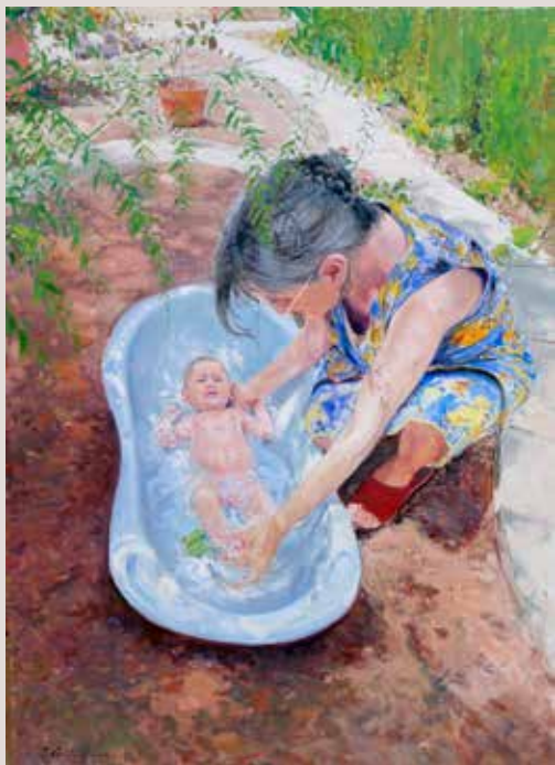
EL BANY (Oli sobre llenç, 100 x 73 cm)