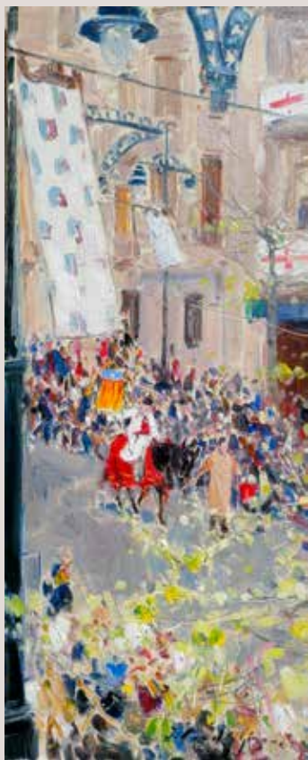
MASERO A CAVALL (Oli sobre llenç, 46 x 19 cm)