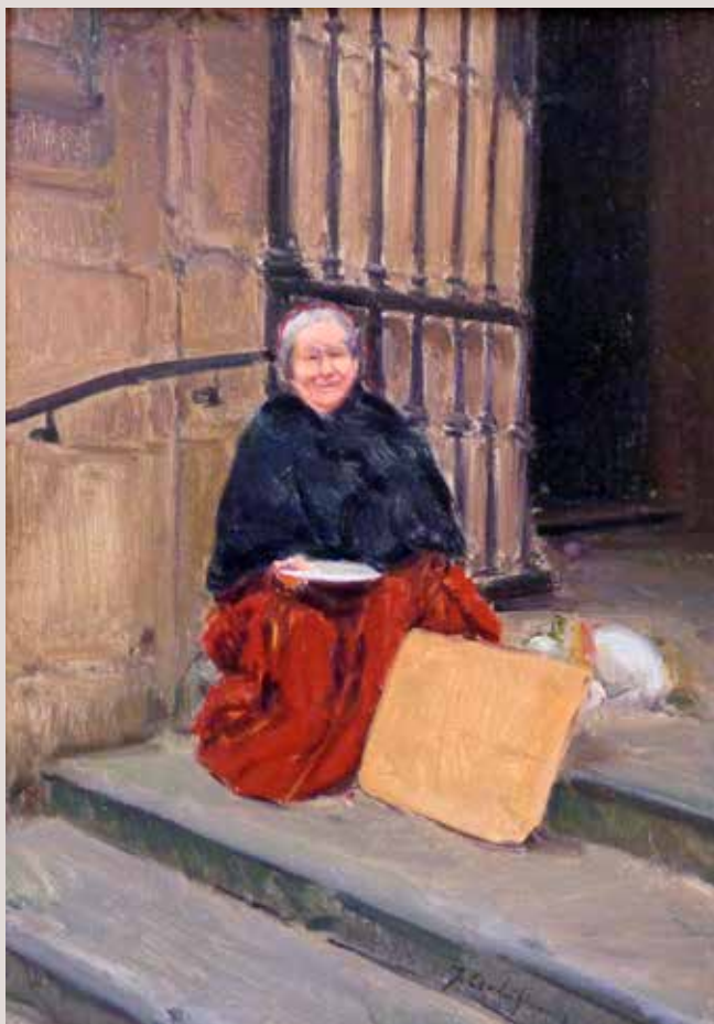
MOLTES GRÀCIES (Oli sobre llenç, 46 x 33 cm)