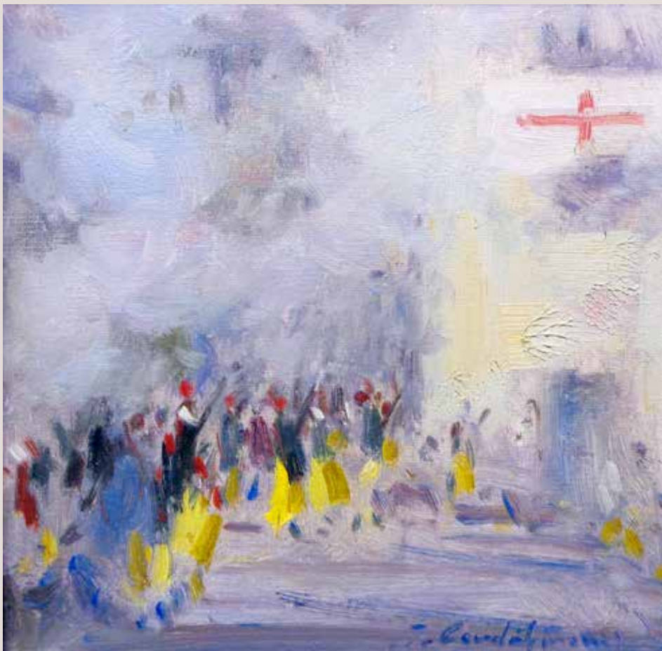
TETS (Oli sobre llenç, 21 x 21 cm)