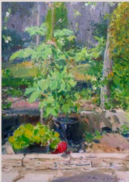
FLOR ROJA DEL JARDÍ (Oli sobre llenç, 46 x 33 cm)