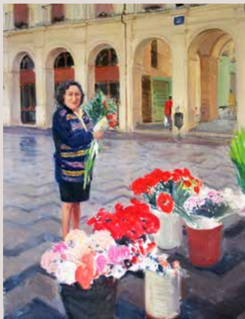
ENTRE FLORS (Oli sobre llenç, 92 x 73 cm)