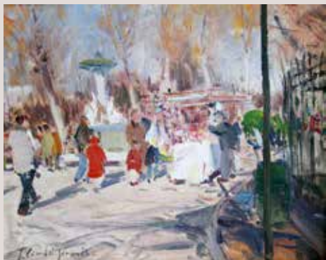
FESTA DEL RETIRO (Oli sobre llenç, 22 x 27 cm)