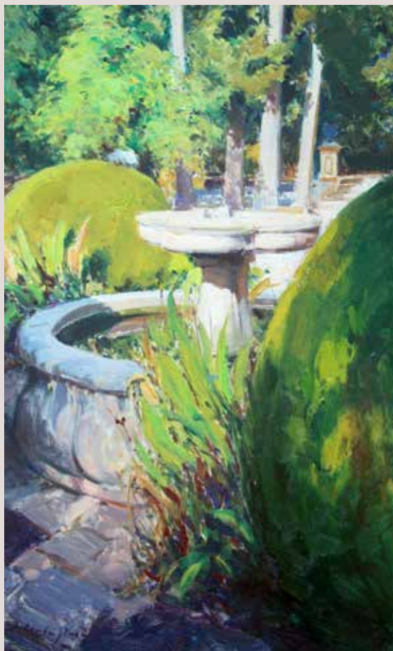
JARDÍ DE GRANADA (Oli sobre llenç, 61 x 38 cm)