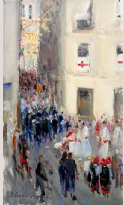
MASEROS (Oli sobre llenç, 41 x 24 cm)