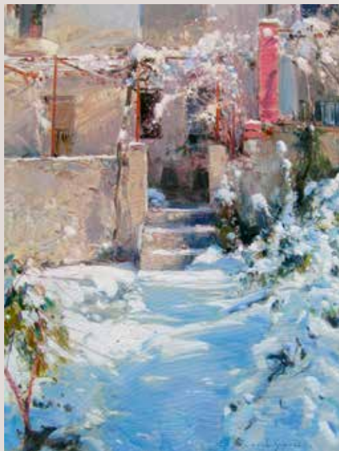
PATI AMB NEU (Oli sobre llenç, 61 x 46 cm)