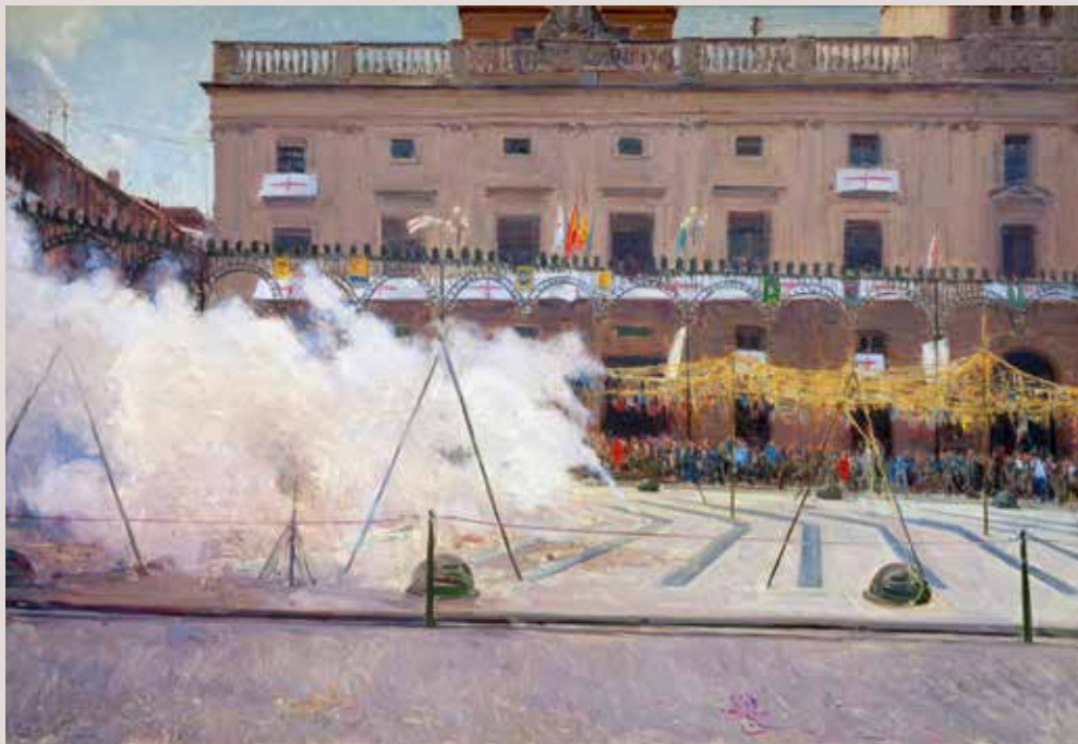
MASCLETÀ A LA PLAÇA (Oli sobre llenç, 80 x 130 cm)