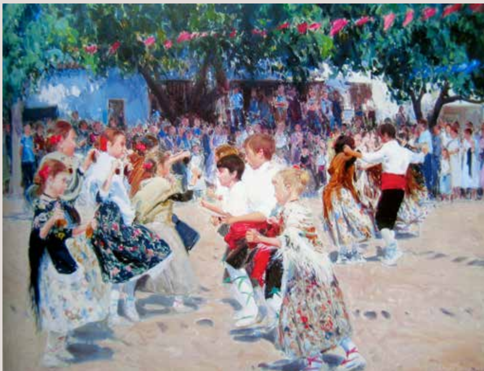
DANÇA DE BARTXELL (Oli sobre llenç, 89 x 116 cm)