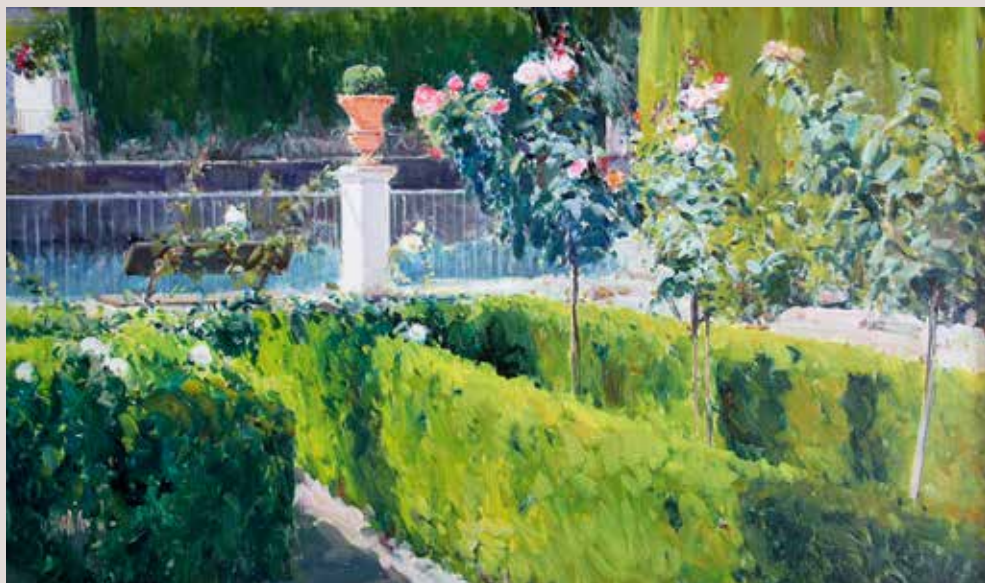
JARDÍ DE SANTOS (Oli sobre llenç, 60 x 100 cm)