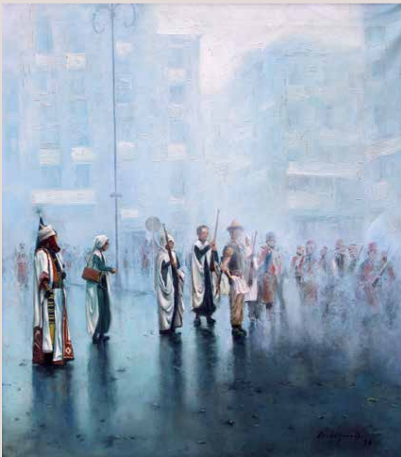
EL ALARDO (Oli sobre llenç, 65 x 60 cm)