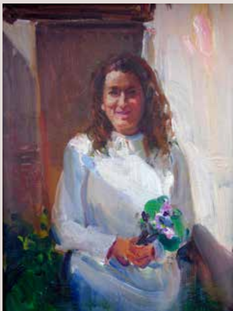
EVA I LES SEUES VIOLETES (Oli sobre llenç, 35 x 27 cm)