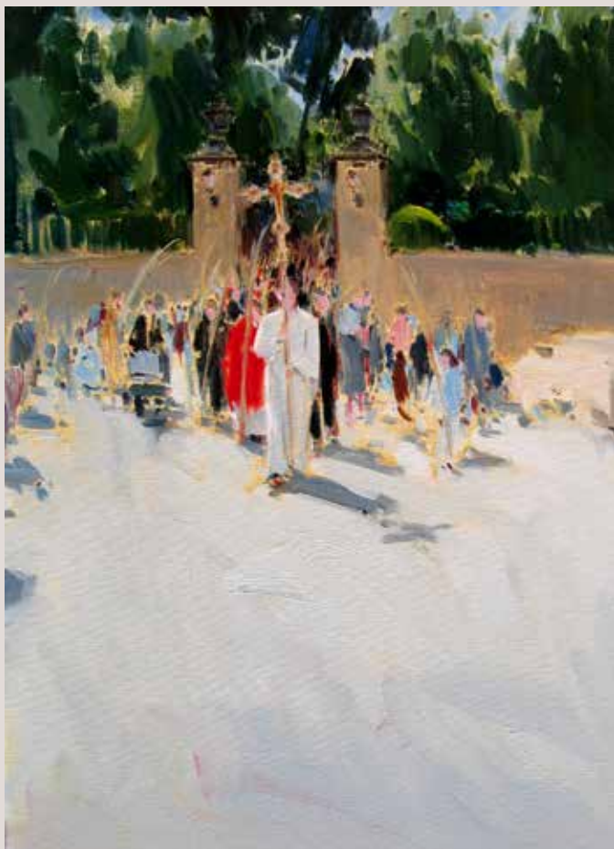
RAMS EN LA GLORIETA (Oli sobre llenç, 46 x 33 cm)