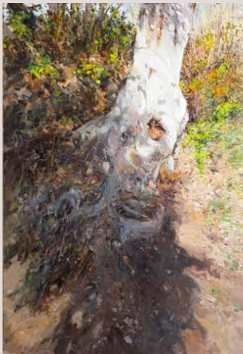
SOCA (Oli sobre llenç, 130 x 89 cm)