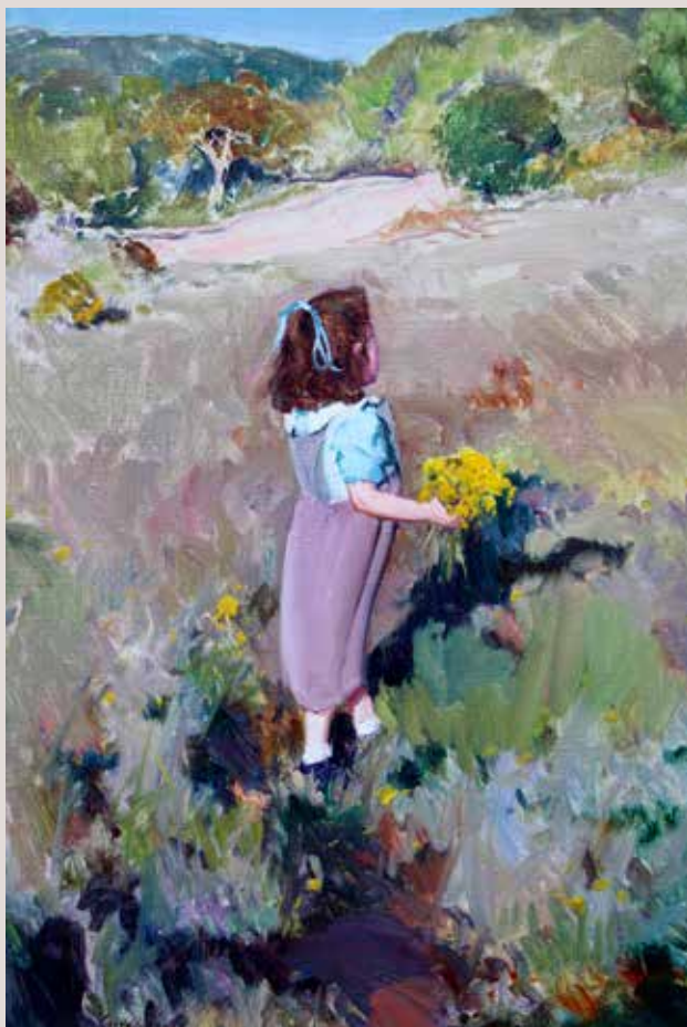
LUCÍA AMB RAM (Oli sobre llenç, 55 x 38 cm)