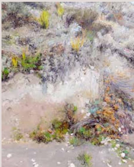
TERRAPLÉ (Oli sobre llenç, 195 x 162 cm)