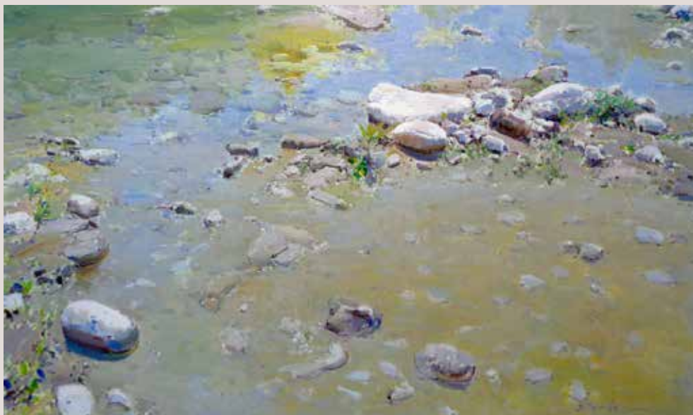
PEDRES DEL SERPIS (Oli sobre llenç, 60 x 100 cm)