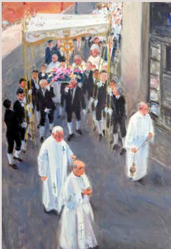
PROCESSÓ CORPUS (Oli sobre llenç, 55 x 33 cm)