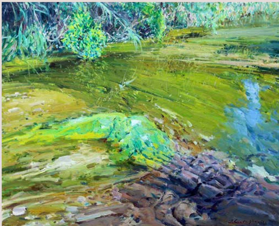
SERPIS (Oli sobre llenç, 65 x 81 cm)