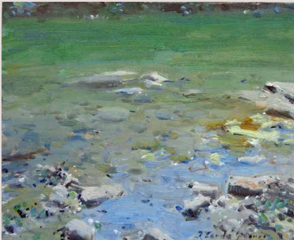
APUNT SERPIS 1 (Oli sobre llenç, 22 x 27 cm)