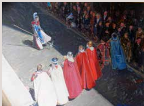
CRISTIANS (Oli sobre llenç, 54 x 76 cm)