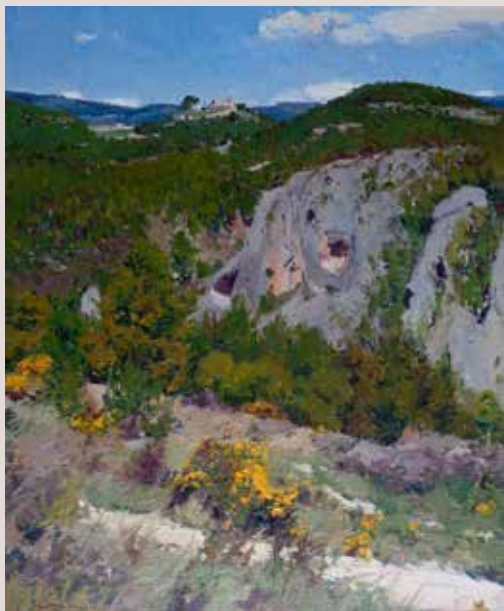
CASTELL DE BARXELL (Oli sobre llenç, 61 x 50 cm)