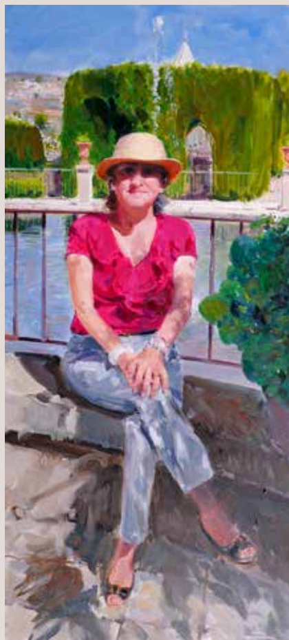
ELENA EN JARDÍN DE SANTOS (Oli sobre llenç, 110 x 50 cm)