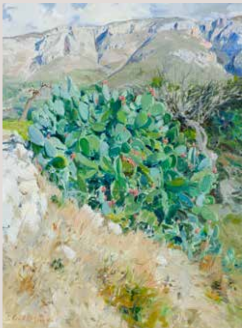
LA XORTÁ (Oli sobre llenç, 81 x 60 cm)