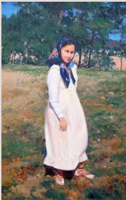
LUCÍA EN EL MAS (Oli sobre llenç, 92 x 60 cm)