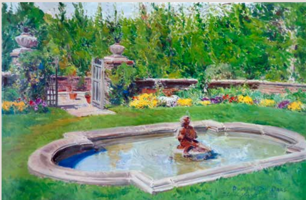
ESTANY DE DUMBARTON OAKS (Oli sobre llenç, 60 x 92 cm)